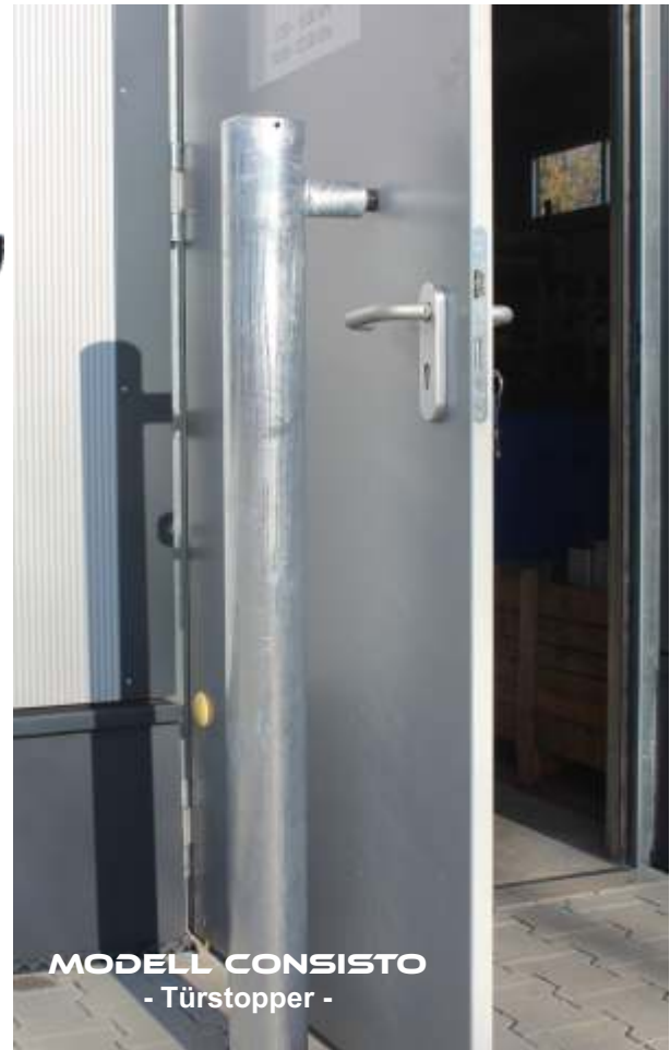
MODELL CONSISTO - Türstopper -

siehe auch Produktgruppe EDELSTAHL Seite 75