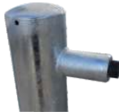
Fußplatte 150 x 150 x 8 mm