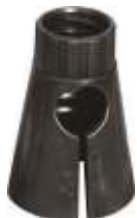
13126 ZA Adapter für PVC Leitkegel 70x105 mm, PP, 0,06 kg Aufsatz für 500, 750, 900 mm Leitkegel aus PVC 3,80 €/Stk