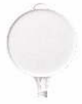
13120 HR Schild-Rund klein (d) 280 mm PP, 0,20 kg 5,90 €/Stk