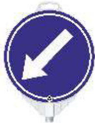
13229 HL Vorbeifahrt-links einseitig reflektierend Klasse RA 2 (d) 380 mm, PP, 0,48 kg 16,90 €/Stk