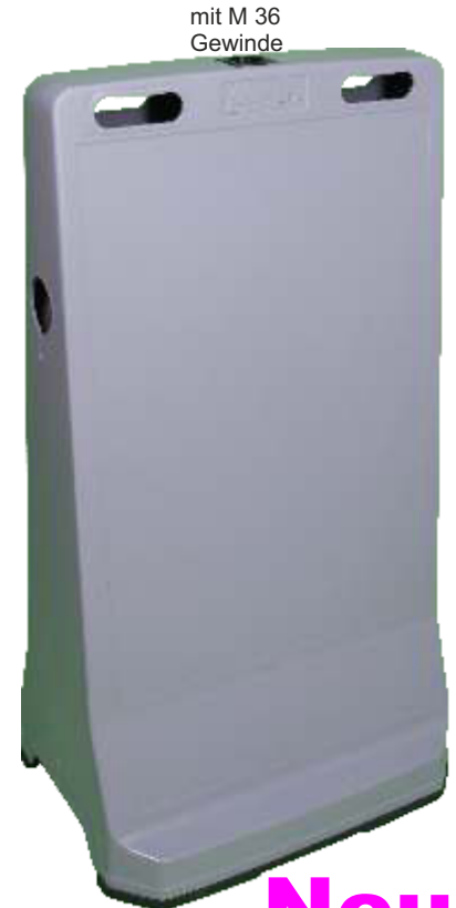
mit M 36 Gewinde