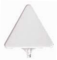
13110 HD Schild-Dreieck Seitenlänge 440 mm PP, 0,35 kg 7,60 €/Stk