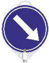
13230 HR Vorbeifahrt-rechts einseitig reflektierend Klasse RA 2 (d) 380 mm, PP, 0,48 kg 16,90 €/Stk