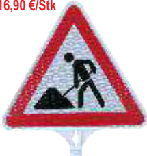
13131 HD Bauarbeiten Seitenlänge 440 mm PP, 0,36 kg einseitig reflektierend Klasse RA 2 16,90 €/Stk