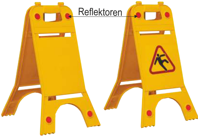
13107 OF Warnaufsteller neutral 245x620 mm, PP, 1,09 kg 15,30 €/Stk