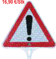
13130 HD Achtung Seitenlänge 440 mm PP, 0,36 kg einseitig reflektierend Klasse RA 2 16,90 €/Stk