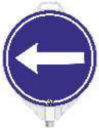
13122 RL Fahrtrichtung beidseitig reflektierend Klasse RA 2 1 x rechts- und 1 x linksweisend (d) 380 mm, PP, 0,48 kg 16,90 €/Stk