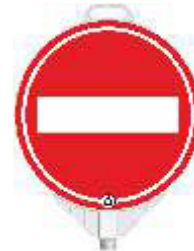
13121 HR Durchgang verboten einseitig reflektierend Klasse RA 2 (d) 380 mm, PP, 0,48 kg 16,90 €/Stk