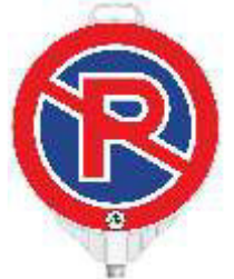
13124 HR Parkverbot beidseitig reflektierend Klasse RA 2 (d) 380 mm, PP, 0,48 kg 16,90 €/Stk