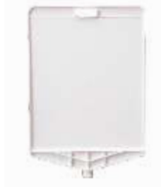
13111 HV Schild-Viereck Werbefläche 350x410 mm PP, 0,50 kg 7,60 €/Stk