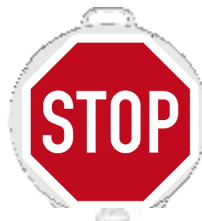
Neu 13121 ST Stop einseitig reflektierend Klasse RA 2 (d) 380 mm, PP, 0,48 kg 16,90 €/Stk