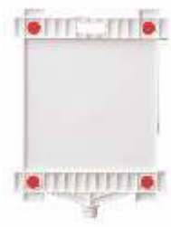
13112 HV Schild-Raute Werbefläche 300x300 mm PP, 0,40 kg 7,60 €/Stk